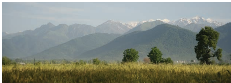
Виды Исмаилинского района

В Азербайджане можно наблюдать все четыре времени года: пышная растительность влажных субтропиков со-