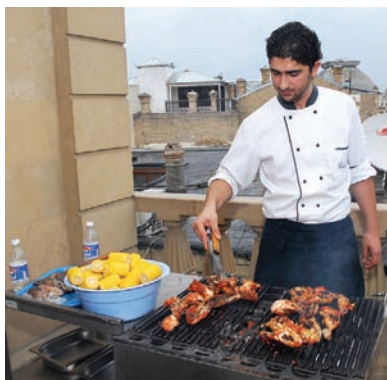
Азербайджанские повара славятся своим мастерством

Азербайджан — настоящий рай для гурманов. Радужный прием и исключительный сервис в ресторанах и кафе гармонично сочетаются с разнообразными и недорогими блюдами местной кухни, широким выбором фруктов и овощей, пьянящим ароматом специй и мастерством местных поваров.