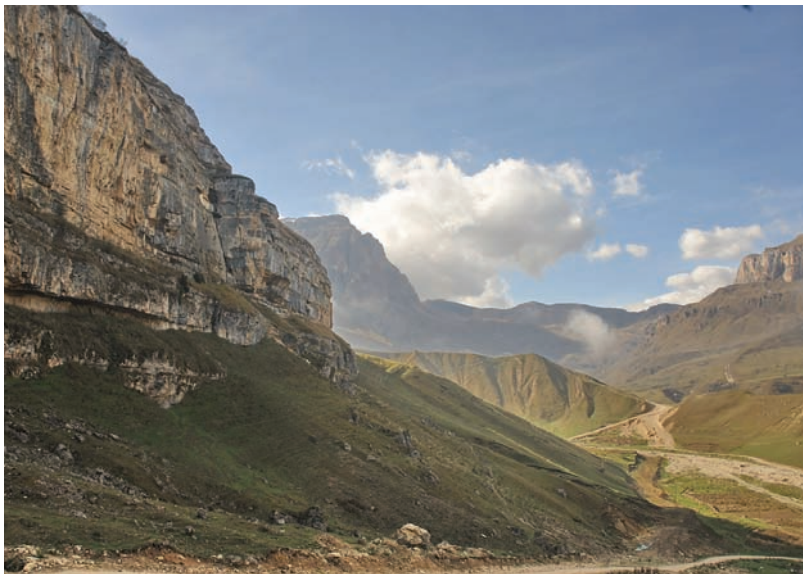
Окрестности селения Лаза

Территория страны как бы наклонена к Каспийскому морю, куда стекают все реки Азербайджана. Каспий уникален по своему происхождению и биоресурсам. В море и устьях впадающих в него рек обитают осетр, севрюга, белуга, лосось, кутум, шемая, сельдь, минога, сом, щука, жерех и другие виды рыб.