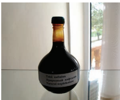
Лечебная мазь Нафталан

неральными источниками являются одновременно туристическими центрами. Располагаются они в районах Губа, Шамахи (Шемаха) — Исмаиллы, Масаллы — Лянкяран (Ленкорань), Балакен (Белоканы) — Загатала (Закааталы), Шеки — Габала (Кабала), Нахчыван (Нахичевань), Гянджабасар. Абсолютно уникален Нафталан — единственное в мире месторождение лечебной нефти.