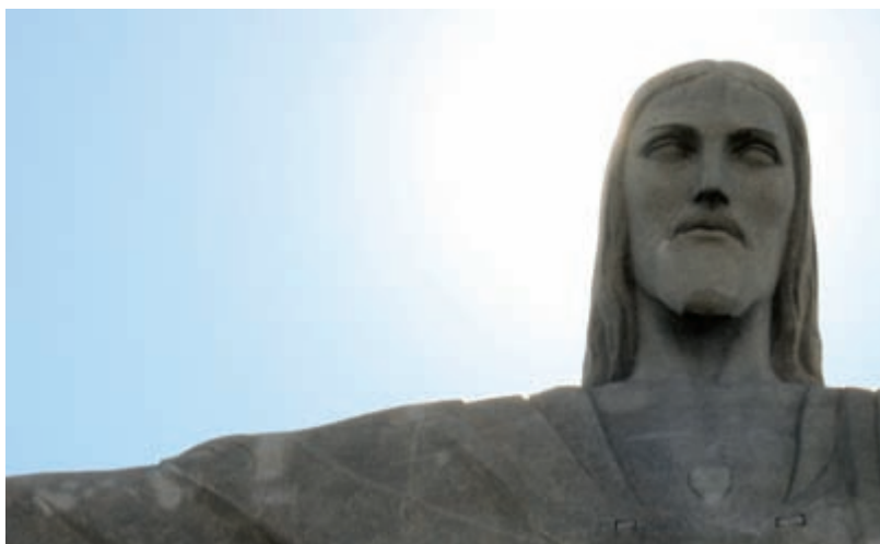
Вознесшаяся над Рио в 1931 г. статуя Христа Спасителя — дар Франции

рет власть в свои руки, и в стране начинается долгий период военного правления.