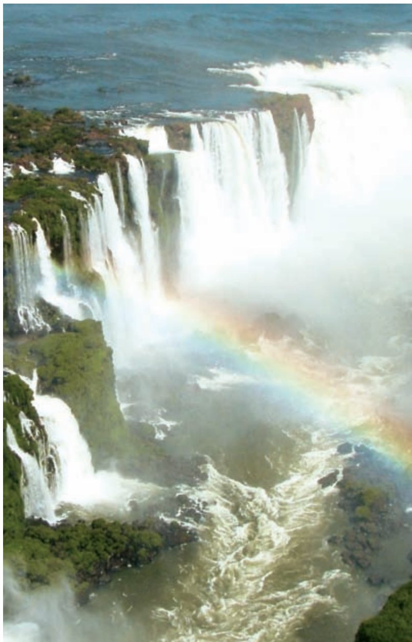
Вид с воздуха на водопады Игуасу