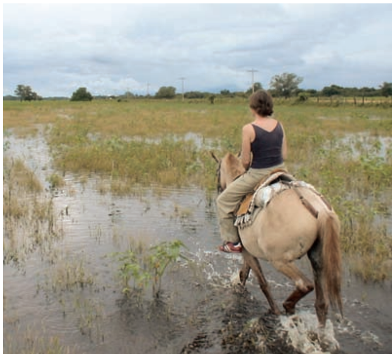
Заболоченные земли Пантанала

ные на еще не освоенный европейцами континент из Африки, жили и работали в условиях, аналогов которым в истории человечества не так много. Впрочем, и сегодня ситуация немногим лучше. Почти половиной плодородных земель страны владеет всего 1% ее населения (см. статью «Лула и безземельные» на с. 106–107). Страна действительно непомерно богата ресурсами, однако из-за глубоко укоренившейся коррупции и неумелого управления лишь малая толика ее богатств перепадает обычным людям. Притом что Бразилия — один из крупнейших мировых экспортеров продуктов питания, четверть ее населения голодает.