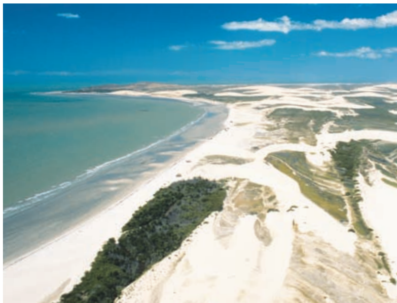
Обрамленный дюнами пляж на северо-востоке Бразилии

Проявления гедонизма повсеместны и разнообразны. В живущем напряженной деловой жизнью мегаполисе Сан-Паулу супербогатые перемещаются от здания к зданию на вертолетах, а бары и клубы работают 24 часа в сутки. Посреди зеленого моря Амазонии действует оперный театр, не уступающий по своему уровню и великолепию лучшим оперным подмосткам Европы. И все в этой удивительной стране пронизано задевающей за живое музыкой — от оглушительных африканских ритмов Баии и эротичного байле-фанка фавел до мягкого джаза баров, в которых знатоки одновременно наслаждаются изысканным вкусом популярного коктейля кайпиринья .