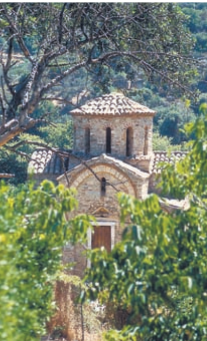
В критском поселении Фоделе родился Эль Греко

церквей. Они молились за себя и за своих отцов и сыновей, которые скрывались в горах.