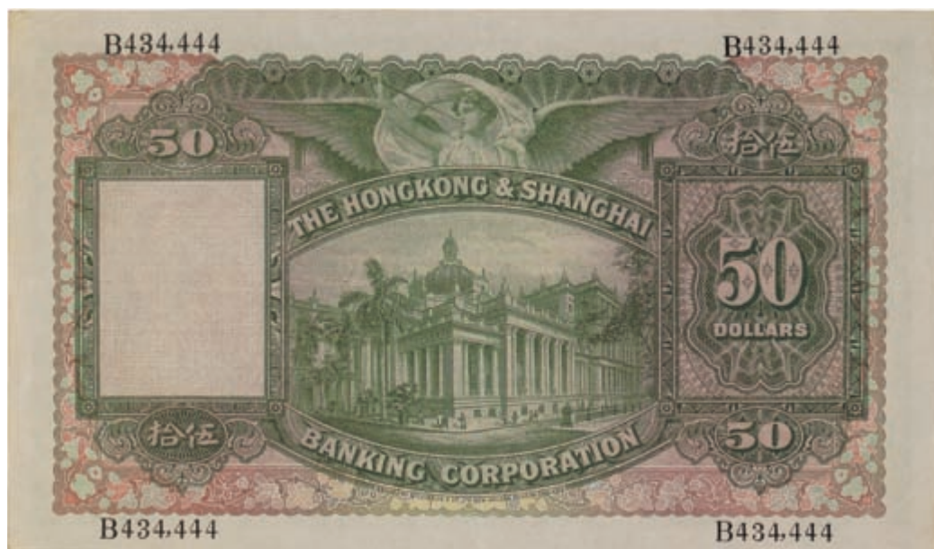
Рис. 1. Пятидесятидолларовая купюра банка «The Hongkong & Shanghai Banking Corporation», 1934 год. С самого своего основания в 1865 году он стал основным эмитентом Гонконга, способствуя внедрению современной западной банковской практики в некоторых восточноазиатских странах. Ныне банк является дочерним предприятием холдинга «HSBC Holdings plc»

Как подступиться к столь трудному предмету? Можно было бы начать с общих рассуждений о человеческой природе, с изучения места денег в различных культурах и сообществах с антропологической точки зрения или же рассмотреть данный вопрос в свете экономики, привлекая статистику и общие представления, на которые опираются экономисты и историки экономики. Однако здесь используется не антропологический и не экономический, а исторический подход.