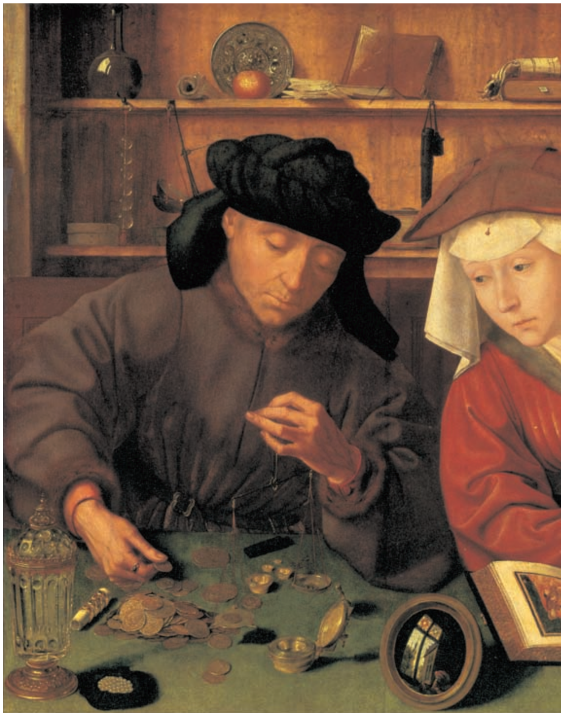
Рис. 3. Картина Квинтена Массейса «Меняла с женой», 1514 год. Париж, Лувр