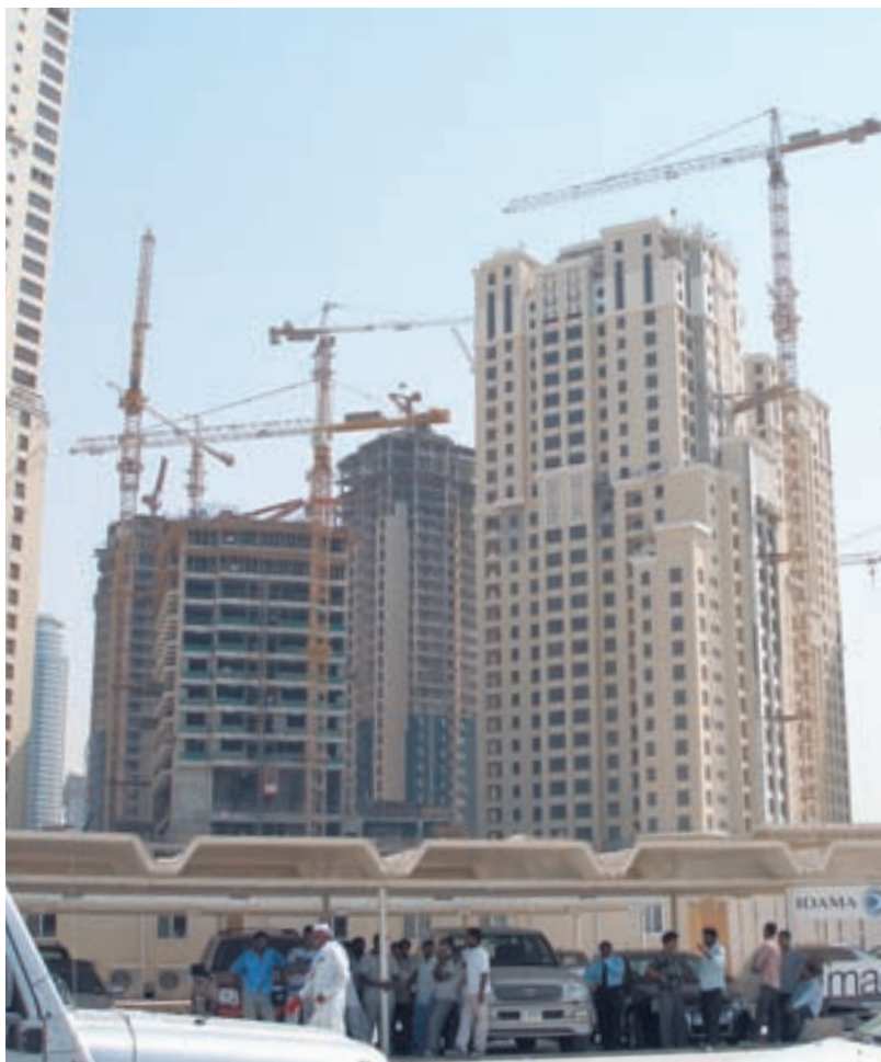
Экономический кризис сильно ударил по строительству

дарственный инвестиционный конгломерат «Dubai World» смог выплатить долги. Нынешнему правителю страны, шейху Мухаммеду, пришлось испытать унижение, а крохотный эмират на песке обнаружил свое слабое место.