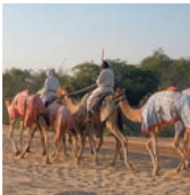
Для них песок под ногами лучше асфальта

Барханы, нанесенные на юго-востоке преобладающими северо-западными ветрами, различаются по цвету: от белого и кремового до глубокого красно-коричневого. Пустыня между Абу-Даби и Дубаем совершенно непривлекательного тускло-серого цвета. Пейзаж оживляют только редкие серо-зеленые верблюжки колючки и следы от колес машин. Внутренние районы пустыни более приятны для глаз. Песок приобретает золотистый, теплый оттенок, а на закате становится красным, что делает пустыню в это время суток великолепным зрелищем. Краснота песка объясняется присутствием окиси железа, что считается особенностью засушливого климата. В конце последнего ледникового периода — приблизительно 15 тыс. лет назад — большая часть нынешней пустыни была покрыта богатой растительностью. Район