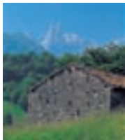
Пики Европы. В этих горах вы увидите самые живописные места Испании (с. 97)