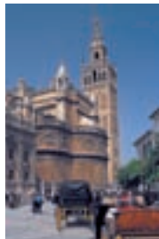
Собор в Севилье. Собор вместе с главной своей достопримечательностью, колокольней Хиральдой, является самым большим готическим храмом мира (с. 60)