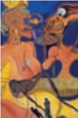
Сальвадор Дали. Его работы сосредоточены преимущественно на Коста-Брава (с. 73)