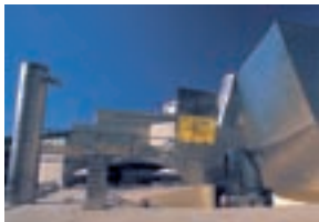
Музей Гуггенхайма в Бильбао. Футуристический музей — главная достопримечательность Страны басков (с. 107–108)