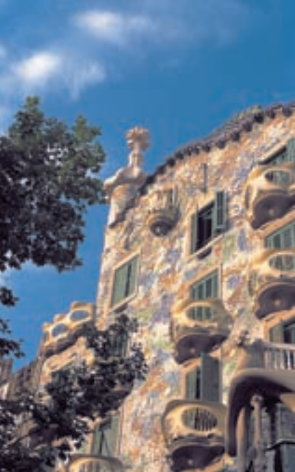
Модернизм в Барселоне

лые люди, придающие большое значение вежливости в отношении и друг друга, и чужих людей.