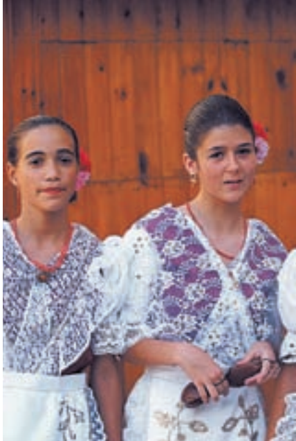
Костюмы подчеркивают региональную идентичность — эти женщины из Мурсии

Хотя регионы сильно отличаются по обычаям и характеру, испанский образ жизни един повсюду. Испанцы очень любят детей, преданы семье и друзьям. Это открытые, общительные люди, отдающие должное хорошему вину и еде. В целом можно сказать, что испанцы — очень жизнерадостные, счастливые и весе-