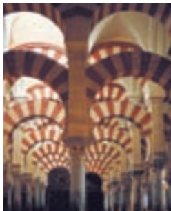
Ла-Месquita в Кордове. Потрясающий образец искусства мавританских архитекторов (с. 63)