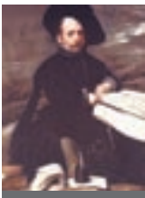
Музей Прадо. Это настоящая сокровищница искусства — одна из главных достопримечательностей Мадрида (с. 34)