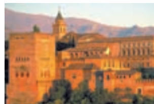
Альгамбра в Гранаде. Самый грандиозный памятник мавританского искусства (с. 66)