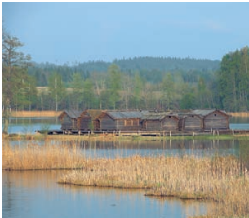
Дома на сваях на живописном озере Арайшу в районе Видземе

не только XXI, но даже и XX в. Большая часть территории страны покрыта болотами и лесами, где обитают медведи, лоси и волки.