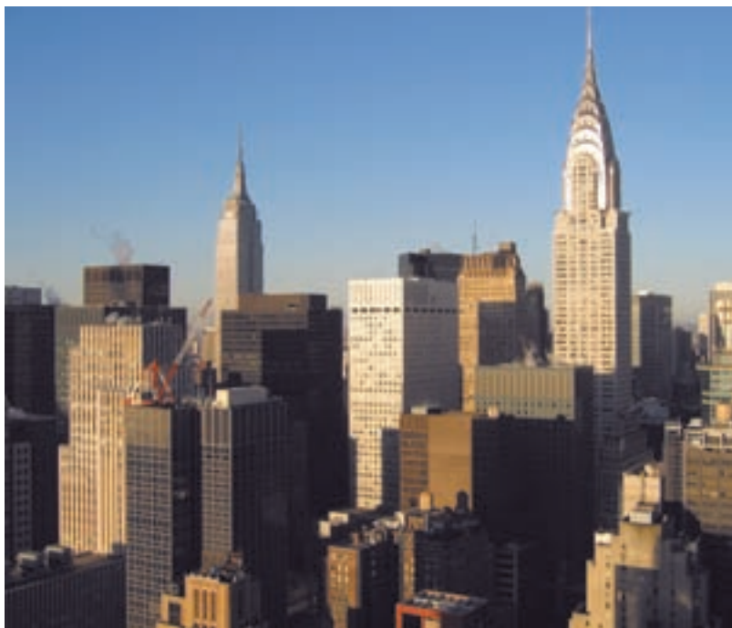
Силуэты, ставшие легендой: Эмпайр-стейт-билдинг (слева) и Крайслер-билдинг