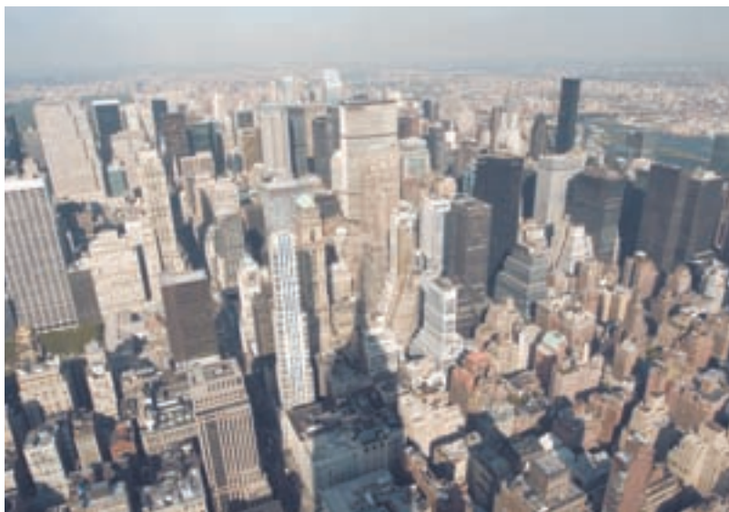
Манхэттен свысока взирает на Бронкс

Манхэттен — та часть города, в которой его гости проводят большую часть времени. Здесь расположены знаменитые нью-йоркские небоскребы, музеи, всемирно известные бутики и театры Бродвея. Многие уголки Манхэттена известны по сотням кинофильмов.