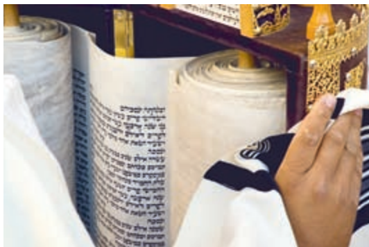
Исконные свитки Торы хранились в ковчеге Завета, который находился в Первом храме