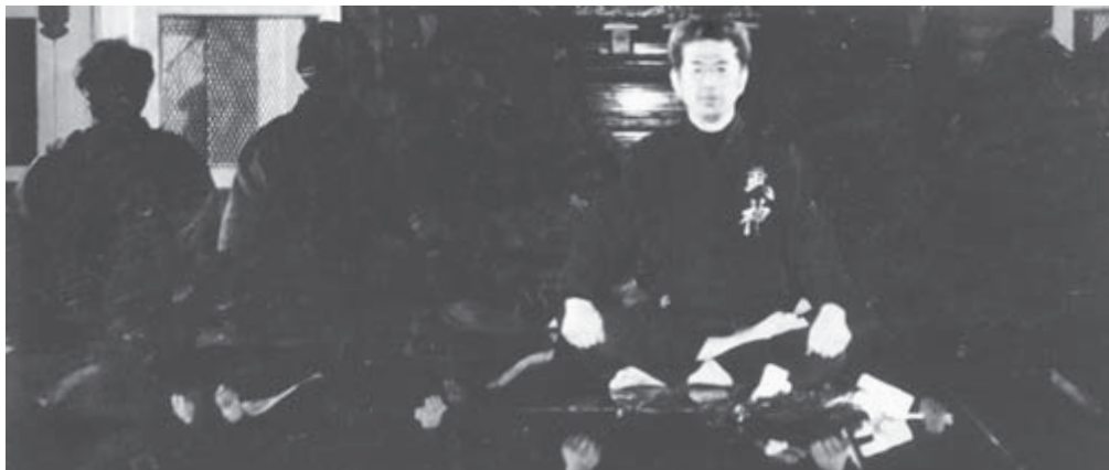
«Сидящий неподвижно под сенью славы». Автор в главном зале обители Хокося на горе Тогакуси, где зародилось его искусство

сил» у Окумэ-но Микото при создании государства и у государя Дзимму при покорении Ямато [древнее название Японии], согласно сказаниям, происходившем примерно в 600 г. до н. э. Некоторые древние документы свидетельствуют также, что принц Сётоку (574—622) прибегал к услугам синоби.