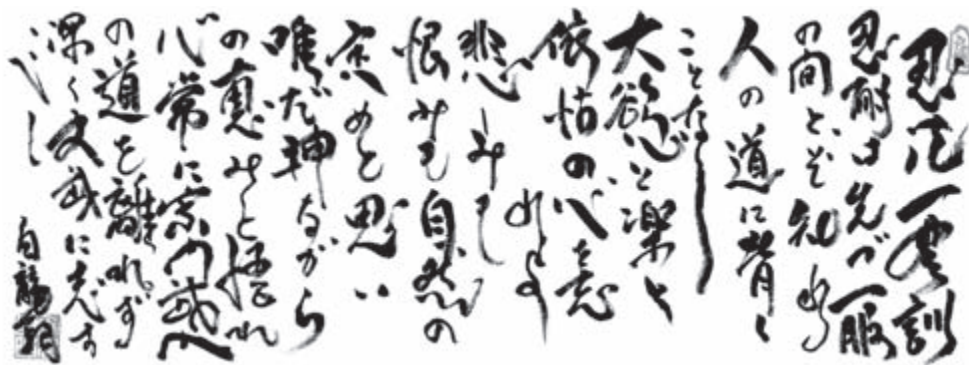
«Заповеди упорства в нимпо»