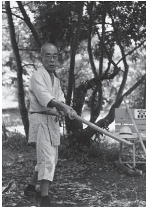
Обучение хамбодзюцу, приемам с шестом длиной около метра ( продолжение на с. 25 )

Например, заметив, как воробьи или куры поздно вечером скребутся в поисках пищи или ищут ночлега высоко в густой листве, либо как тучи мотыльков или иных насекомых летом летят в дом, либо как карп плещется на поверхности водоема, можно заключить, что надвигается дождь. И наоборот, если коршуны кружат высоко в небе, а воробьи и куры рано садятся на насест, почти забросив поиски пищи, значит, будет хорошая погода. Если насекомые, обычно обитающие на верхушках деревьев, устремляются вниз, если жаворонки, обыч-