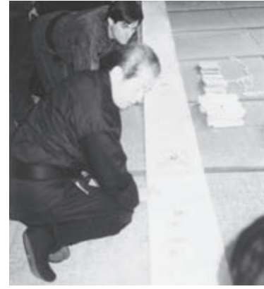
«Раз в год при знакомстве моих учеников с дэнсё я беседую со своим учителем»

В хайку каждая строфа наподобие вышеприведенных именуется «ку», но данный иероглиф обозначает огромное число, как на языке хинди слово «шанкх» (раковина; сто тысяч триллионов), выражая представление о бесконечной вселенной. Подобно тому как эти хайку вызывают в воображении бесконечное число запахов, так и каждая короткая фраза в синоби кудэн порождает невероятно обширные, глубокие и различные смыслы. Кстати, японский камиё-модзи (туземное японское письмо, существовавшее до проникновения китайских иероглифов: дословно «письмена века богов») также включает слова, которые передают все многообразие мира всего лишь несколькими письменами. Это тоже кудэн.