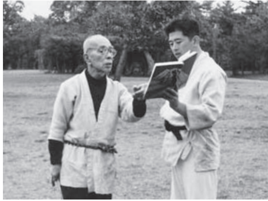
Автор, задающий вопрос учителю Такамацу

но летающие высоко, начинают свистеть, опустившись значительно ниже, и если стелются листья камыша, степная трава, значит, приближается буря.