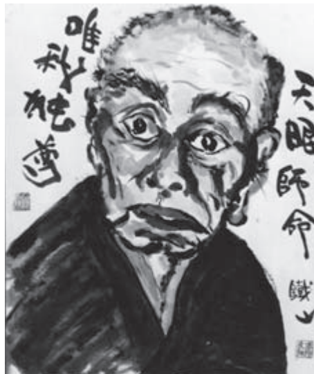
Сэнсэй (учитель) Такамацу Тосицугу