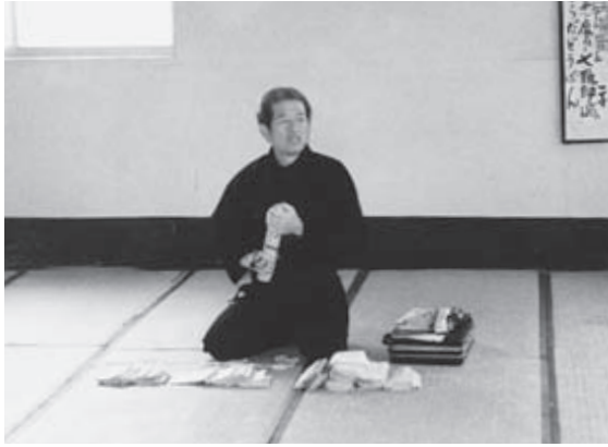
Сокровище автора: письма от учителя Такамацу за пятнадцать лет