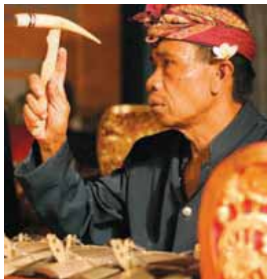
Музыкант gamelan приготовился играть

Лучшее место для знакомства с традиционными танцами и музыкой Бали — это Убуд. Каждый вечер на различных площадках проходят четыре-пять представлений. На отдаленные площадки зрителей доставляют бесплатным транспортом. Большой популярностью пользуются танцы обезьян ( kecak ) и львов ( barong ), а также грациозные танцовщицы legong . Во время некоторых