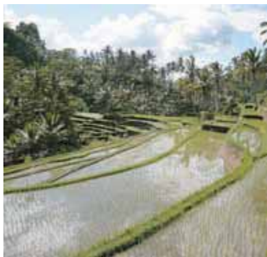
Рисовые поля Бангкиансидема