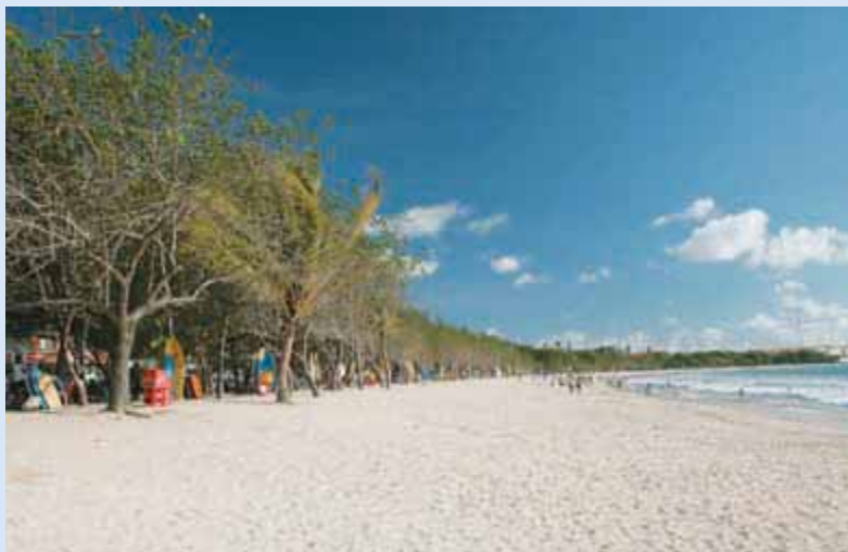
Пляж Куты — первое место, где останавливаются большинство из тех, кто приезжает на Бали

К востоку от Денпасара раскинулся пляж Санур (Sanur). Волны здесь слабые, поэтому пляж идеально подходит для семей с детьми (а во время отлива здесь может оказаться даже слишком мелко). Вдоль пляжа работает множество компаний, предлагающих свои услуги дайверам и любите-