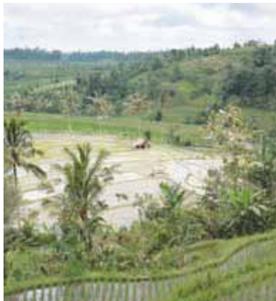
Необычные рисовые поля близ Джатилувиха