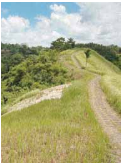
Дорога, проложенная по холмам, Чампухан

Продолжаем идти на юг до храма Пура Гунунг Лебах. Переходим мост и поднимаемся на холм к дороге, которая идет к курорту Ibah Spa & Luxury Villas. Отсюда сворачиваем налево и возвращаемся в Убуд или сворачиваем направо, переходим реку и выходим к Музею Антонию Бланко. Музей находится прямо за мостом.