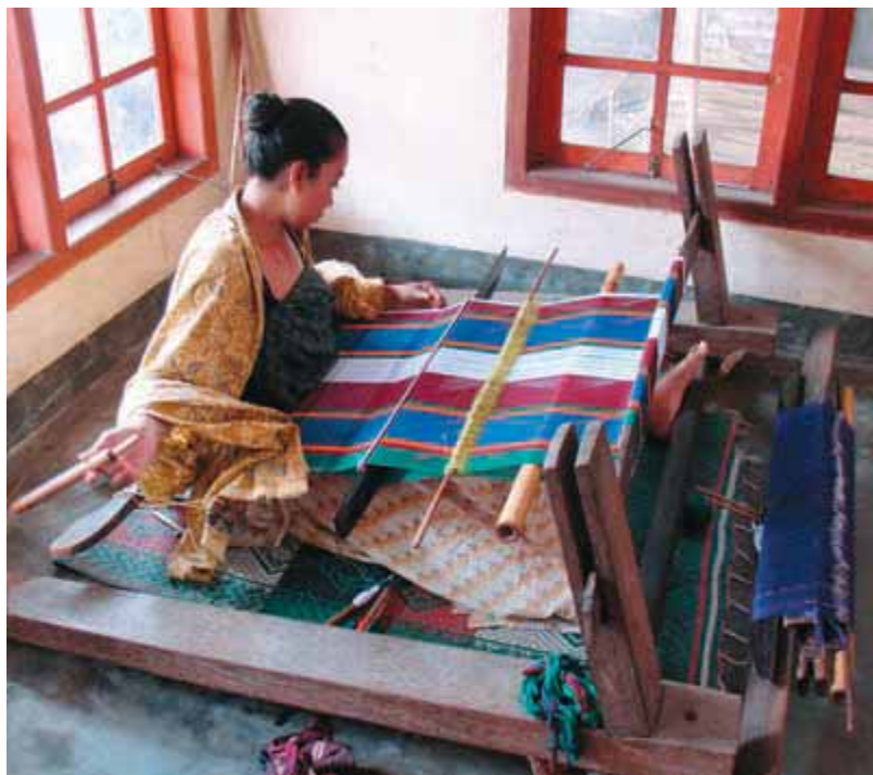
Ткачиха ткёт традиционный сонгкет в Принггаселе

Парковка и въезд в национальный парк платные. Возвращаемся в Kembang Kuning и сворачиваем направо. Через 1 км мы оказываемся в Тетебату.