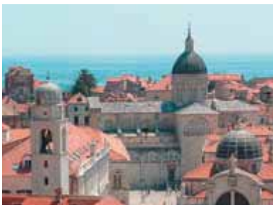
Барочный собор Вознесения

Мы попадаем в Старый порт, где издревле швартуются торговые суда Дуб-