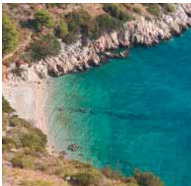
Крохотные бухточки — идеальное место для пикника

Продолжаем двигаться на восток по направлению к Сучураю ( Sučuraj ). Остров Хвар мало населен. По дороге вы увидите лишь несколько крохотных деревушек. Берег круто обрывается к морю, и человеку просто негде поселиться. Через 12 км после деревни Застражище ( Zastra-