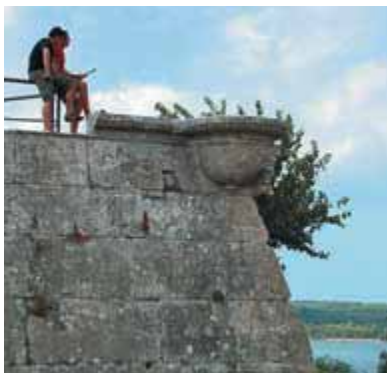
Со стен Кастро открывается сказочный вид

Пройдя под аркой, сворачиваем налево на параллельную улицу, Карраина (Carrarina), и идем примерно 50 м до ближайшего перекрестка. Здесь сворачиваем направо на улицу Амфитеатарску (Amfiteatarska). Впереди появляются массивные стены римского амфитеатра.