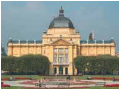
Павильон искусств на площади Короля Томислава

У музея сворачиваем направо на улицу Руньянинову ( Runjaniнова ) и движемся по ней до перекрестка Водниковой/Михановичевой ( Vodnikova/Mihanovićeва ). Слева от нас находится ботанический сад.