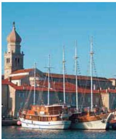
Туристические кораблики в порту города Крк

Из Крка движемся на восток по дороге 29 в направлении Пуната (Punat). Мож-