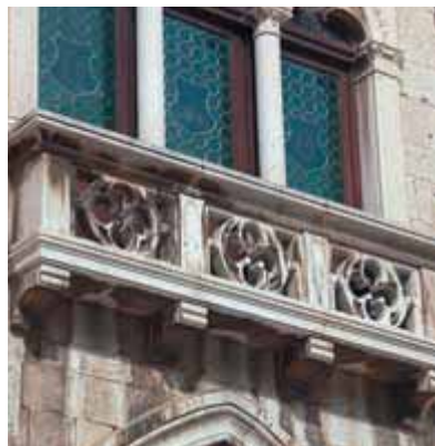
Изысканные ренессансные балконы

Можно пройти подвалами к морю через Медные ворота. Эти ворота ранее использовались только торговцами и ремесленниками. Но мы предлагаем вам вернуться к перистиллю и свернуть налево на улицу Крешимирову (Krešimirova). По ней