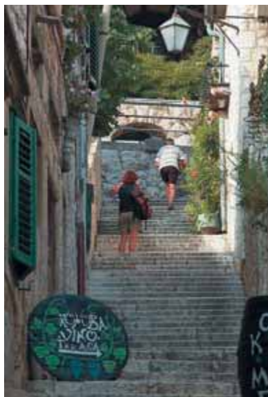
Поднимитесь по крутым лестницам Хвара

В Стари-Граде можно увидеть развалины древних стен, а также фунда-