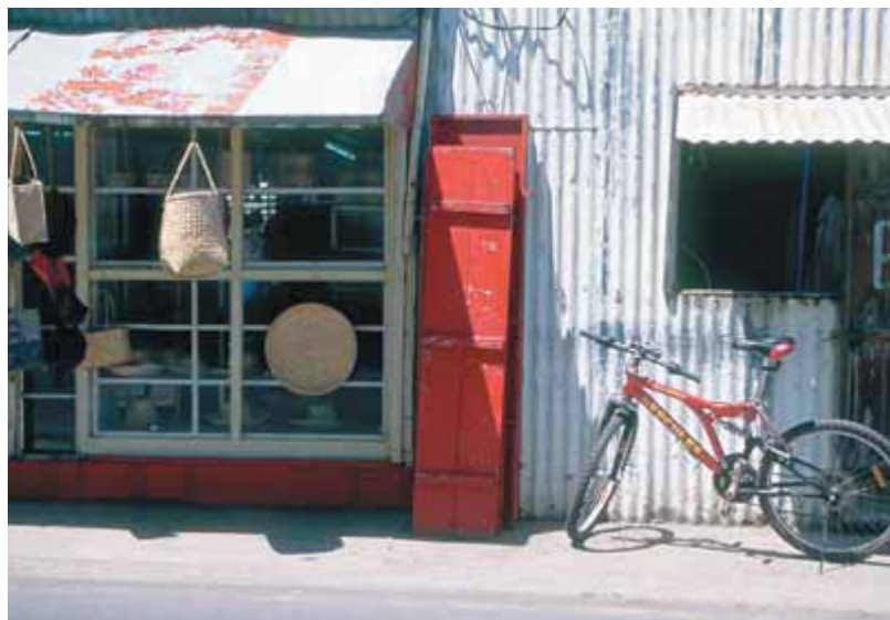
Главная улица сонного Порт-Матюрен, остров Родригес

Кому позволяет время, должны обязательно побывать на одном из островков — наибольшей популярностью пользуются Северные острова. Тут можно полностью уединиться в тропическом раю. Если вы приехали на три недели или не первый раз на Маврикии, съездите на «антистрессовый остров» Родригес, который называют «Маврикием 50 лет назад».