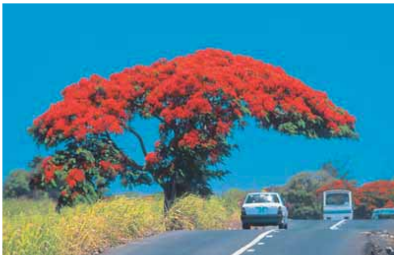
Ярко цветущее дерево возле дороги на севере острова

ловато. Этот регион расположен в стороне от избитых троп. Здесь можно познакомиться с природными, традиционными и историческими особенностями Маврикия.