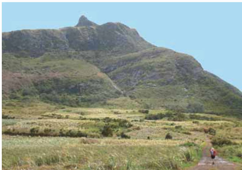
Прогуляйтесь по предгорьям в направлении Ле-Пус