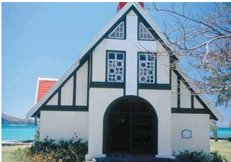
Церковь Нотр-Дам-Экселатрис, Кап-Малёрэ

В северной части острова можно найти место на любой вкус — от спокойного Кап-Малёрэ, где можно совершить прогулку на катамаране на Северные острова или просто укрыться от суеты, до оживленного Гран-Бэ — центра ночной жизни Маврикия, славящегося своими ресторанами и развлечениями. Исторические достопримечательности слегка потерялись между изысканными отелями уютных полуостровов, пляжными бунгало и недорогими гостиницами. Если вам хочется уединения, можете отправиться на лодке вокруг островка Иль-д'Амбр, где затонул злополучный «Сен-Жеран», или на горном велосипеде прокатиться по природному заповеднику.