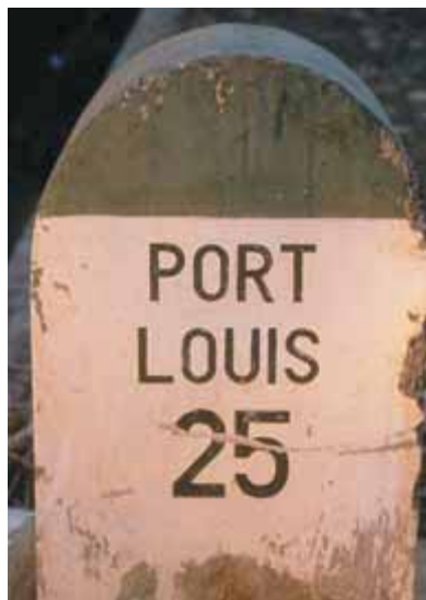
Старый километровый столб показывает расстояние до столицы Порт-Луи

На юго-востоке и юго-западе сосредоточены основные достопримечательности острова, хотя пляжей здесь ма-