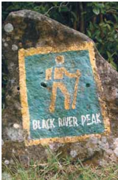
Начало прогулки «Пик Черной реки»