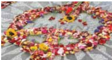
Мемориал Джона Леннона

Летом каждое воскресное утро на глади озера проходят увлекательные гонки радиоуправляемых моделей судов. На его северном берегу дети могут лазить по отлитой в бронзе Алисе и другим персонажам кэрролловской «Страны чудес», слушать сказки у подножия статуи Ханса Кристиана Андерсена на западном берегу.