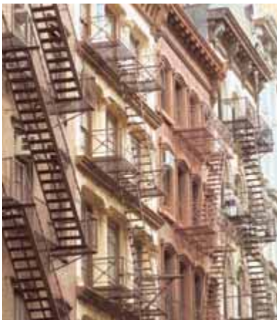
Зигзаги пожарных лестниц на старых зданиях Трайбеки

По White St дойдите до West Broadway и сверните налево, чтобы оказаться у станции метро Franklin St.