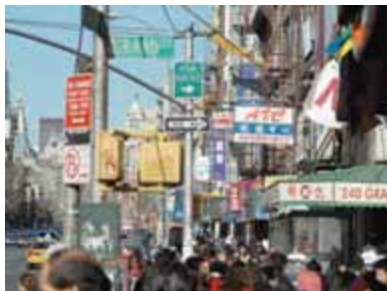
Бурлящий, неутомимый анклав

На углу Мотт- и Парк-стрит возвышается построенная в начале XIX в. величественная церковь Преображения, прихожане которой — китайские католики. Первоначально это был храм сионской епископальной церкви. Под № 8 размещается Китайская ярмарочная аркада и музей. Мотт-стрит — неутомимое сердце нью-йоркского Чайнатауна, место, где можно приобрести недорогую кухонную утварь, палочки для еды, котелки-вок, а также деликатесы мандаринской, шанхайской, кантонской, хунаньской, сычуаньской, вьетнамской и других дальневосточных кухонь. Здесь же можно найти ингредиенты для приготовления многих восточных блюд и широкий ассортимент национальных сувениров, включая мозаики из полудрагоценных камней и шелка. Загляните на расположенные поблизости узенькие Пелл- и Доерс-стрит. Их пересечение некогда было известно как «Кровавый угол» — здесь часто складывали тела жертв Таньских войн (раздел сфер влияния этническими группировками). Что касается более светлой стороны жизни, то этот участок Чайнатауна становится эпицентром торжеств в дни празднования китайского Нового года, который местные обитатели отмечают в первое полнолуние после 19 января. В такие дни здесь можно увидеть традицион-