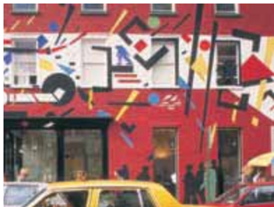
Ярко и с фантазией оформленный фасад здания в Сохо

Улица знаменита самой длинной в городе вереницей «чугунных» домов, протянувшихся под № 8–34 от Канал-стрит до Гранд-стрит. Дом № 28–30 известен как «Королева Грин-стрит» (Queen of Greene Street). Построенный в 1873 г., он располагает многими декоративными деталями, наличие которых стало возможным благодаря появившемуся в XIX в. новому методу строительства с использованием чугунного каркаса и силикатного литья. «Король Грин-стрит» (King of Greene Street) под № 72–76 — великолепное шестиэтажное здание в ренессансном стиле с импозантным колонным портиком. Бывший склад и производственный цех — как и все «чугунные» здания в этом районе, — сегодня «Король» приютил несколько художественных галерей и дорогой антикварный магазин. На юго-западном углу Грин- и Принс-стрит архитектурный облик, обычно присущий только фасадам «чугунных» домов, каза-