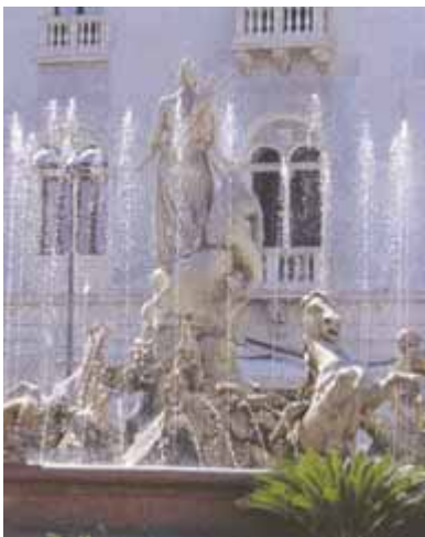
Фонтан на площади Архимеда

Чтобы вернуться к мосту Умбертино, выйдя из музея, сверните налево, а потом снова налево — на Via Roma.