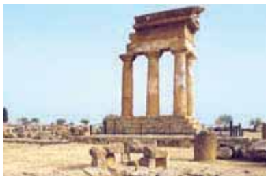
Развалины храма Кастора и Поллукса

Переходим дорогу и по тропинке подходим к Археологическому музею.