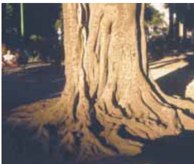
Мошные корни фигового дерева на площади Марина

Это тот редкий случай, когда дворец сохранился со всей обстановкой. Над входом вы увидите герб семьи Филанджери, которой дворец принадлежал до 1980 г. Потом семья передала особняк государству. Очень хороши элегантно обставленные залы и театральный внутренний дворик.