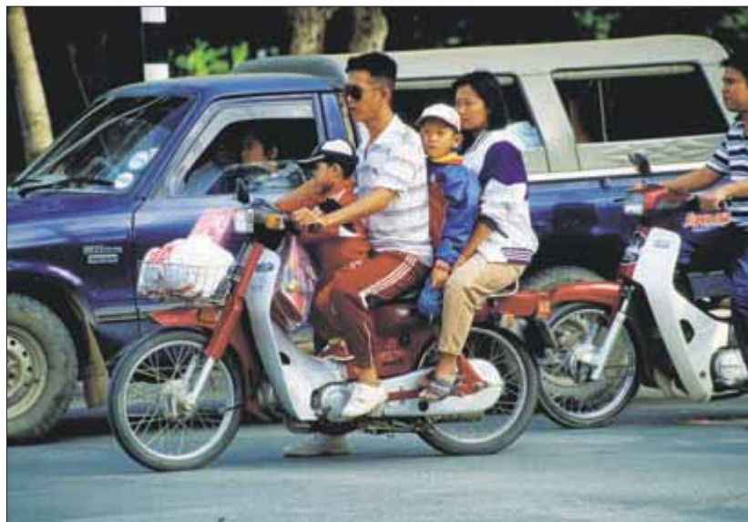
Двухместный мотоцикл всегда можно взять напрокат

Бангкок: Bangkok International Airport (тел.: 0-2535-4031); Чиангмай: Chiang Mai Airport (тел.: 0-5320-1798); остров