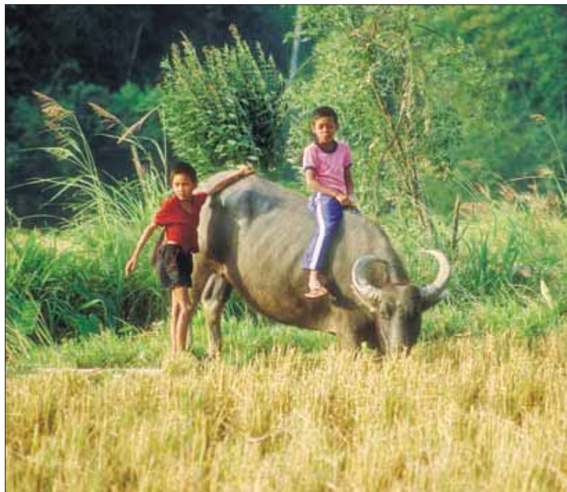
Тайские дети смело ездят верхом на буйволах, но европейцам мы этого не рекомендуем

Пляж Май-Кхао. Здесь на берег выходят морские черепахи. Это происходит с ноября по февраль. Черепахи откладывают яйца в песок (см. с. 117).