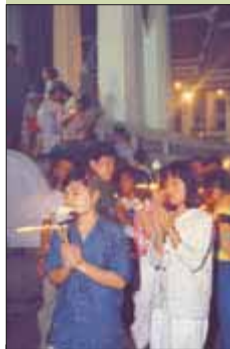
Праздник Висакха Пуджа, Бангкок

В Таиланде масса праздников, и гости из-за рубежа могут присоединиться к этим красочным национальным фестивалям. Некоторые праздники носят местный характер, другие — общенациональный. Но в любом случае праздники всегда сопровождаются танцами, конкурсами красоты и безудержным весельем. Даты проведения праздников из года в год меняются, поэтому всегда уточняйте информацию в Департаменте туризма Таиланда (ТАТ).