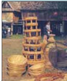
Произведения народных промыслов на ярмарке в Северном Таиланде

В Таиланде можно найти практически все — от слонов из тикового дерева до ярких зонтиков, от лаковых шка-тулок до самой модной одежды. Таиланд — одно из лучших мест для совершения покупок в Юго-Восточной Азии. Покупки — это последний подарок туристам. А кроме того, здесь можно отлично поторговаться!