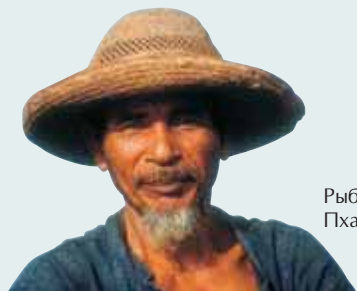
Рыбак из Пхангнга